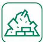
DÉBLAIS / GRAVATS

(Saint-Just-en-Chaussée, Maignelay-Montigny et La Neuville-Roy uniquement)